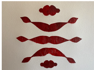
Obra de arte terminada

5. Explora dónde podrías poner la imagen usando la plantilla esténcil. ¿Quieres usarla en el exterior sobre una pared o en la acera? ¿Sobre una camiseta? ¿Sobre otra hoja de papel? Elige un lugar junto con un adulto. Puedes usar una plantilla esténcil varias veces si tienes cuidado de no romper el papel.